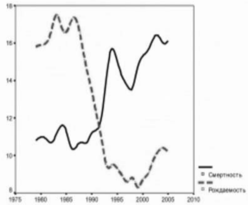
Население России к 2050 году сократится в полтора раза

Виктор: Вот видите. Во всем мире взгляд на алкоголь другой. У нас в России алкоголь – это «клево!» Позитивно и так далее. Это миф российский. У нас если выпил – в центр города поехал сразу же. И все смотрят на него. А там не так. Там пьяный человек вообще старается на люди не показываться. На Руси, кстати, так и было. И это миф, что на Руси пили всегда.